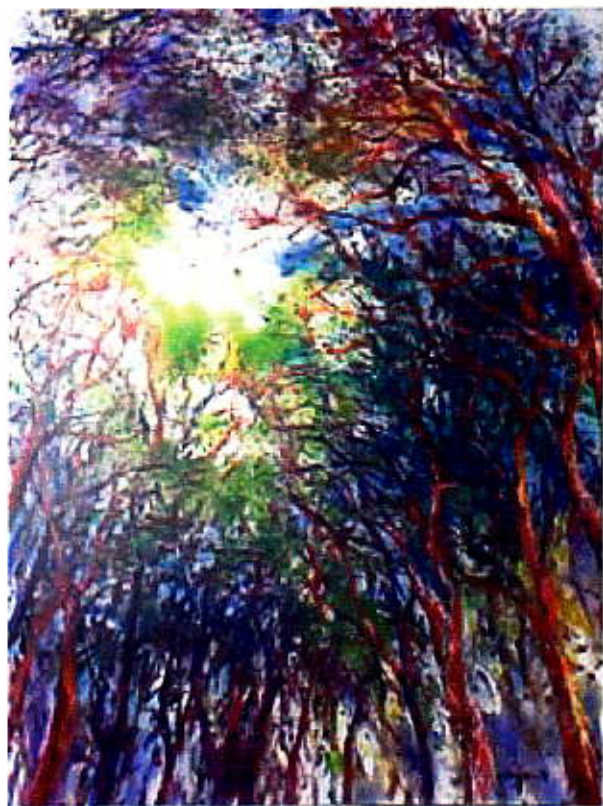
Lumière de la pinède - Fujisang.

Mon esprit vagabonde Mon regard est lointain