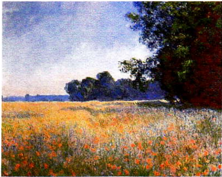
Cat and Poppy Field - Claude Monet.

Un champ où le vent et l'âme peuvent librement s'envoler.